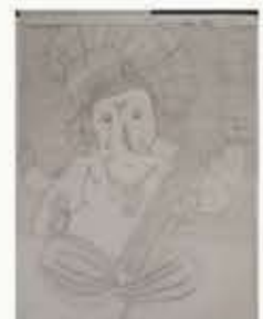
Drawing by Kavya Vinodbhai Bhuva (VI)