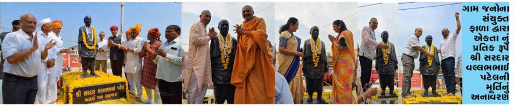
ગામ જનોના સંયુક્ત ફાળા દ્વારા એકતા નું પ્રતિક રૂપે શ્રી સરદાર વલ્લભભાઈ પટેલની મૂર્તિનું અનાવરણ