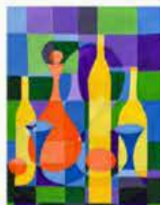
Prajwal Farmeshbhai Vasava (X A)